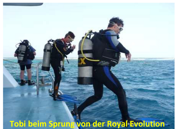
Tobi beim Sprung von der Royal Evolution

Seahorse Tauchausrüstungs und Tauchschule GmbH