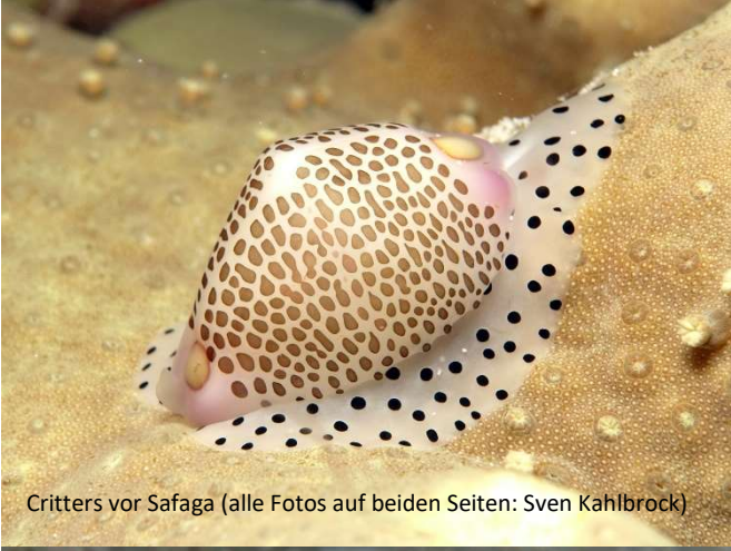
Critters vor Safaga